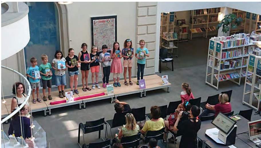
Links und unten: Nationaler Vorlesetag am 18. Mai 2022, Erzählstunde für Kids im Kinderpavillon, Bücherlaufsteg für Primarschulkinder auf der Pizza der Landesbibliothek Glarus.