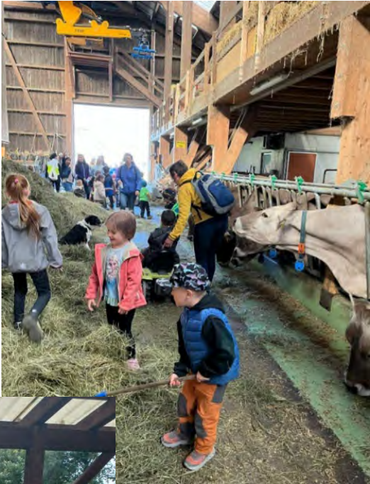
Links/unten: Erzählstunde auf dem Bauernhof Schmid Glarus im März 2022 mit etwa 100 Gästen